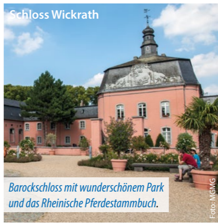
Barockschloss mit wunderschönem Park und das Rheinische Pferdestammbuch.