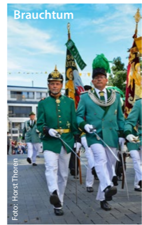
Tradition, Geschichte und Brauchtum – Mönchengladbach ist vielfältig und bietet schöne Erlebnisse.