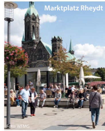
Mönchengladbach – ein lebendiger und leistungsstarker Wirtschaftsort mit dem 4-Sterne MINTO Shoppingcenter.