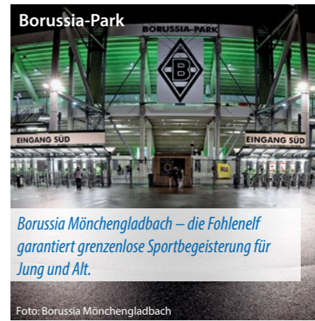
Borussia Mönchengladbach – die Fohlenelf garantiert grenzenlose Sportbegeisterung für Jung und Alt.