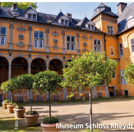
Mönchengladbach verbindet Kontraste – die am besten erhaltene Renaissanceanlage am Niederrhein sowie zeitgenössische und expressionistische Kunst in moderner Architektur.