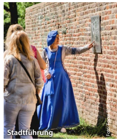
Stadt-Touren für Groß und Klein zeigen die Sehenswürdigkeiten und Impressionen der Stadt. stadttouren-mg.de